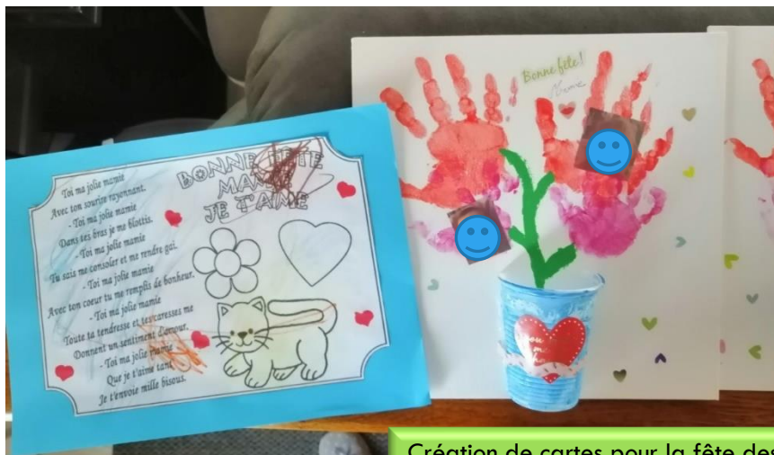
Création de cartes pour la fête des Mamies Carole

N'hésitez pas à partager vos activités, chansons, lectures faites avec les enfants. Cette page vous est dédiée ! Envoyez-nous ces informations ram@cc-beauceloiretaine.fr